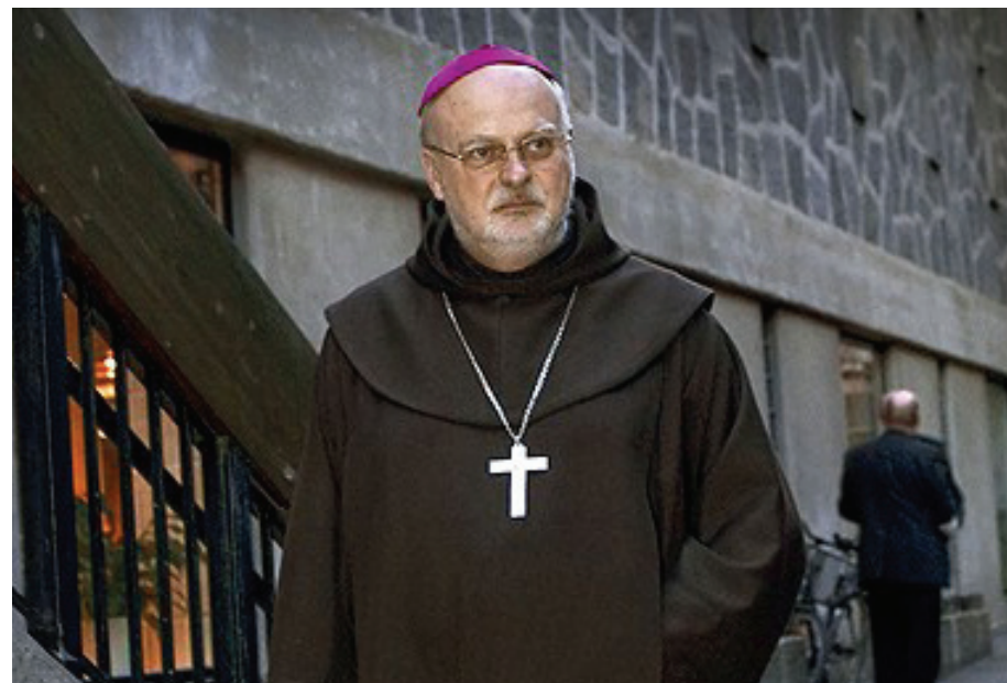
Biskop Anders Arborelius Stockholms katolska stift